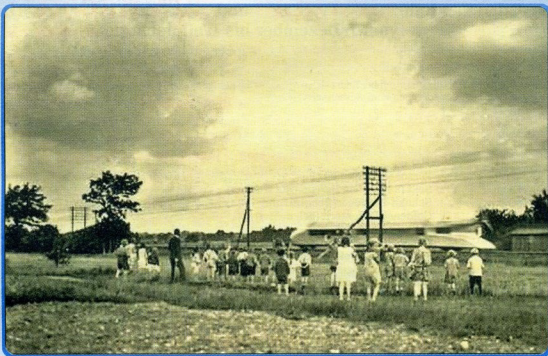
Für großes Hallo sorgte das außergewöhnliche Vehikel damals nicht nur bei den Kindern, sondern auch bei den Erwachsenen.