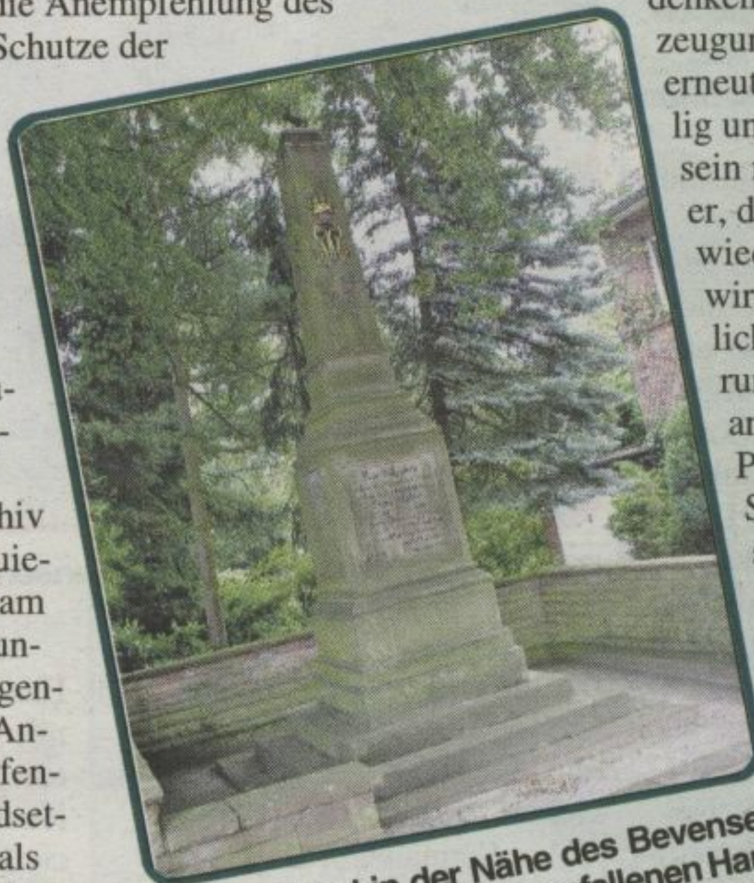
Das Denkmal in der Nähe des Bevenser Bahnhofs erinnert an die gefallenen Hannoveraner in der Schlacht von Langensalza 1866.

und weiteren Themen der Bevenser Geschichte(n) beim Verein Historisches Bevensen e.V., Andreas Springer, Telefon (0 58 21) 4 36 62 oder im Internet unter www.freenet.de/people.de/historischesbevensen/index.html