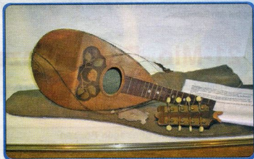
Zerbrochen auf der Flucht – eine Mandoline ist in der Ausstellung der Wollsteiner Heimatstube zu sehen.