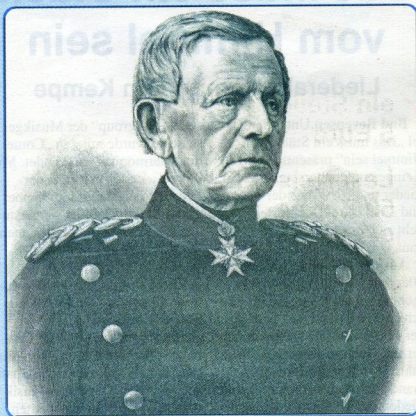
...und Generalstabschef von Moltke, hier in zeitgenössischer Darstellung.

plötzliches Manövriermanöver – „der Kutscher riss die Pferde scharf herum“ – der letzte Wagen des Zuges plötzlich ins Trudeln kam. „Bei diesem Ruck löste sich das rechte Hinterrad des Wagens und trudelte fort. Der Wagen lag mit der Achse im weichen Schnee. Wir Jungen rannten natürlich sogleich zum Wagen hin. Da wurde auch schon der Wagenschlag geöffnet, und kein anderer als Reichskanzler Fürst Bismarck in seiner schmucken Kürassieruniform entstieg dem Wagen. Ihm folgte Generalstabschef Graf Moltke in seiner Generaluniform und mit der bekannten Infanteriemütze auf dem Kopf“. So wurde der junge Augenzeuge von damals zitiert.