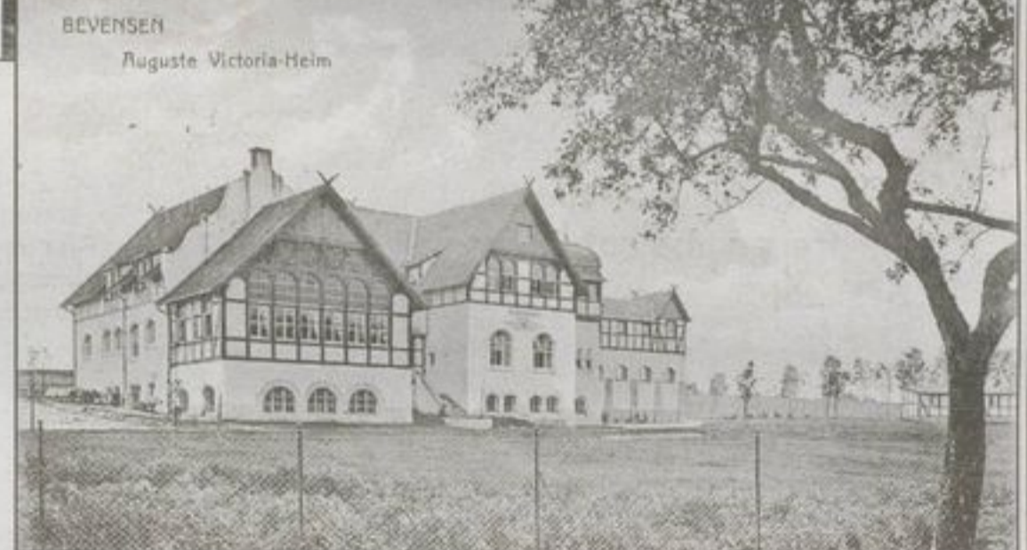
Eine Postkarten-Ansicht des Auguste-Viktoria-Heims von 1915.