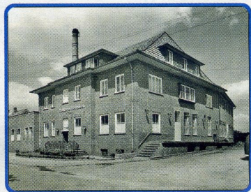
Das Molkerei-Gebäude in seiner Blütezeit.